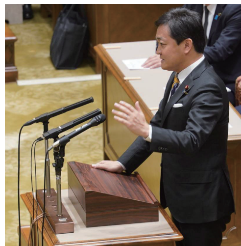
11月26日、党首討論に臨む玉木代表