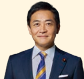
国民民主党代表 玉木 雄一郎

この春の賃上げを非正規雇用や中小企業にも広げ、持続的なものにするためには、手取りを増やして消費を拡大し、売上を増やすことでさらなる賃上げにつなげる好循環が何より重要です。国民民主党は、過去最高となった国の税収を、減税や社会保険料の軽減、生活費の引き下げで国民のみなさんに還元し、手取りを増やします。「まじめに働けば、給料が上がる。」そんな社会の実現のために、国民民主党はこれからも前進していきます。