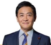
国民民主党代表 玉木 雄一郎

この春の賃上げを非正規雇用や中小企業にも広げ、持続的なものにするためには、手取りを増やして消費を拡大し、売上を増やすことでさらなる賃上げにつなげる好循環が何より重要です。国民民主党は、過去最高となった国の税収を、減税や社会保険料の軽減、生活費の引き下げで国民のみなさんに還元し、手取りを増やします。「はじめに働けば、給料が上がる。」そんな社会の実現のために、国民民主党はこれからも前進していきます。