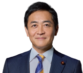
国民民主党代表 玉木 雄一郎

この春の賃上げを非正規雇用や中小企業にも広げ、持続的なものにするためには、手取りを増やして消費を拡大し、売上を増やすことでさらなる賃上げにつなげる好循環が何より重要です。国民民主党は、過去最高となった国の税収を、減税や社会保険料の軽減、生活費の引き下げで国民のみなさんに還元し、手取りを増やします。「まじめに働けば、給料が上がる。」そんな社会の実現のために、国民民主党はこれからも前進していきます。