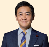
国民民主党代表 玉木 雄一郎

この春の賃上げを非正規雇用や中小企業にも広げ、持続的なものにするためには、手取りを増やして消費を拡大し、売上を増やすことでさらなる賃上げにつなげる好循環が何より重要です。国民民主党は、過去最高となった国の税収を、減税や社会保険料の軽減、生活費の引き下げで国民のみなさんに還元し、手取りを増やします。「まじめに働けば、給料が上がる。」そんな社会の実現のために、国民民主党はこれからも前進していきます。